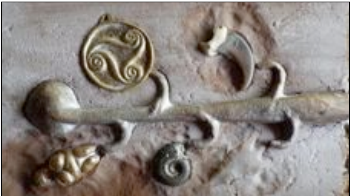
Le travail du bronze est délicat, mais permet de couler de beaux objets

En plus de leur intéressant aspect financier, ces animations spontanées montrent, aux autres visiteurs des après-midis de vacances, les diverses animations qu'offre le Village lacustre.